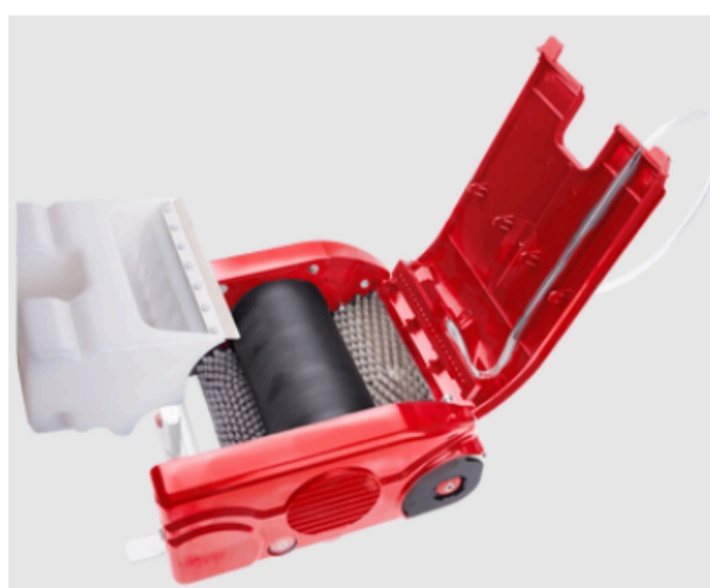
Bac de récupération - semi-fermé. Lame racleuse soudée pour éviter d'éventuelles ruptures.