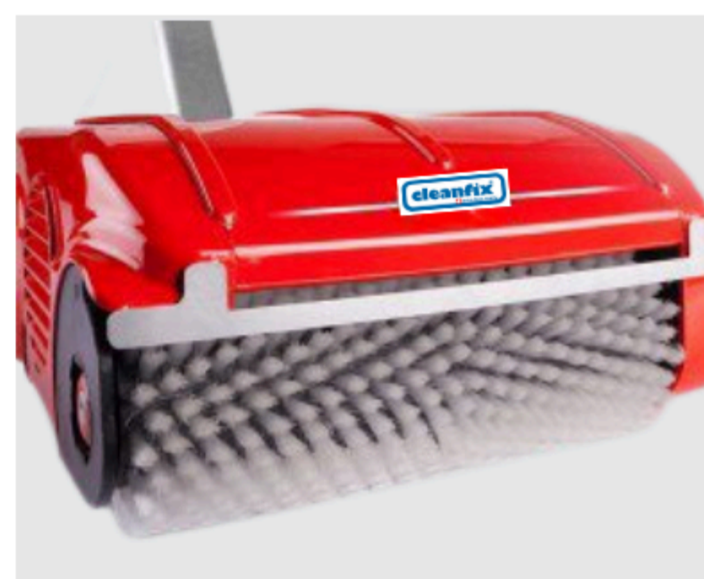
Doubles brosses cylindriques contre rotatives.