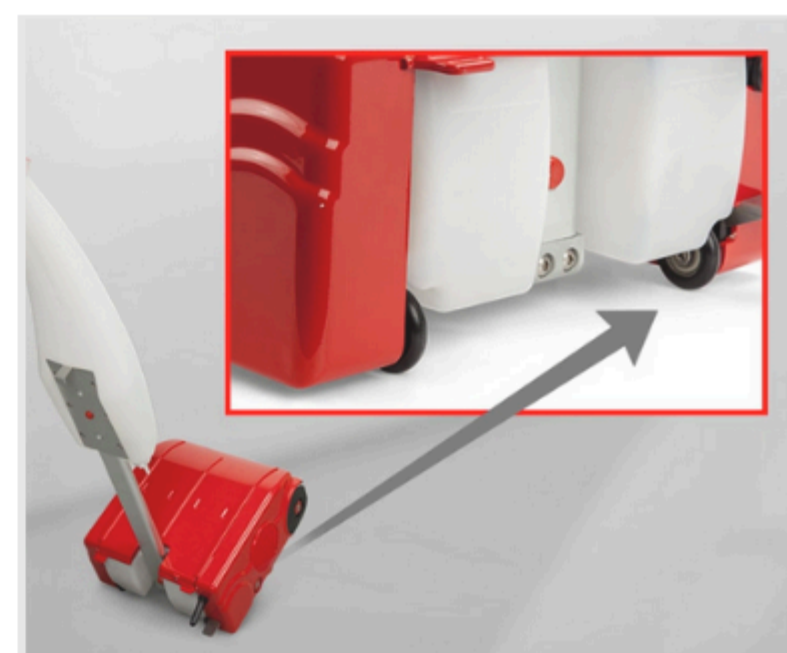
Roues pour le transport.