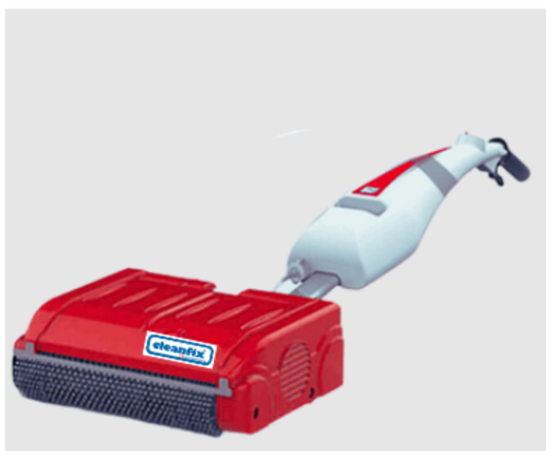
Réservoir inclinable jusqu'à 90° - Passe sous des meubles hauts de 14cm.