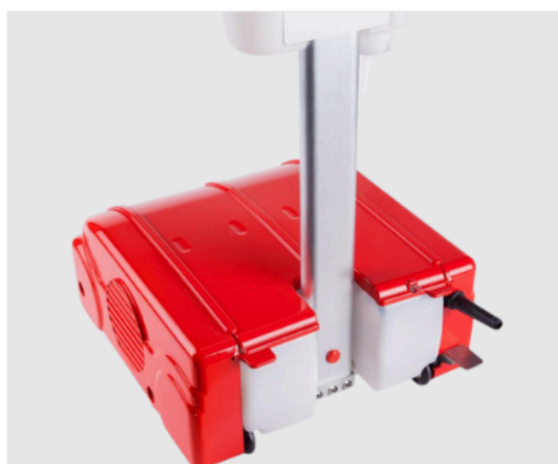
Réservoir réglable en 3 hauteurs.