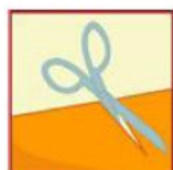
À la coupe