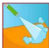
Jet haute pression