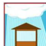
Extérieur sous abri